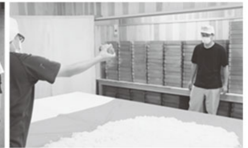
新しい麹室での麹造りの様子