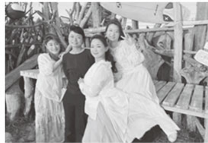
ボーカルユニット日本酒女子さんと コラボ企画を実施中 詳細は4面に

さて、嬉しいニュースです！今年も3年連続で、全国燗酒コンテストにおいて入賞することができました。中でも、当社が一番の定番商品「上撰白老」（常滑で愛されるロングセラーな地酒）はお値打ち熱燗部門で、大変名誉な最高金賞を受賞することができました。また、プレミアム燗酒部門では「夢吟香純米吟醸」も金賞を受賞いたしました。中面では、過去の受賞商品も含めてこれからの季節